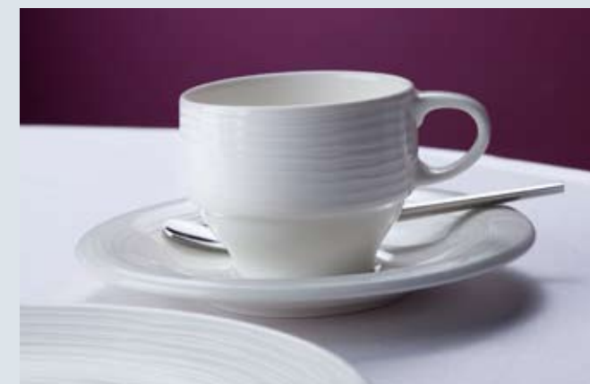
Cups in 3 different sizes – also available in a stackable version. Des tasses de 3 tailles différentes, également disponibles en version empilable. 3 unterschiedliche Tassen-Größen – auch in stapelbarer Ausführung erhältlich! Tres tamaños de taza diferentes: ¡también en versión apilable! Tazze in 3 diverse grandezze – disponibili anche in esecuzione impilabile!