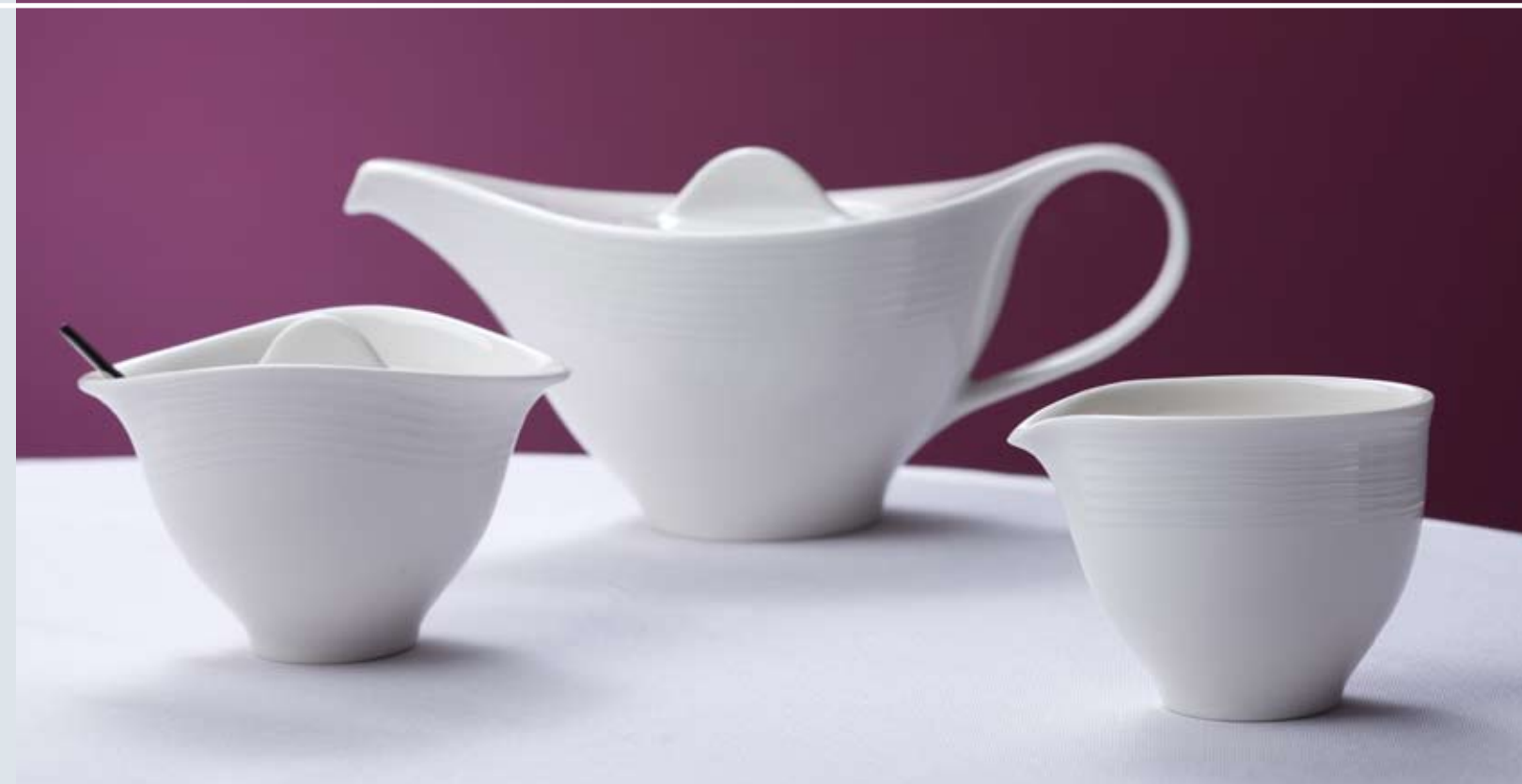
Natural and harmonious lines create a distinctive and stylish personality. Des formes expressives, naturelles et parfaitement harmonieuses. Formen mit Charakter – natürlich und vollkommen harmonisch. Formas con carácter: naturales y totalmente armoniosas. Forme con carattere – naturali e perfettamente armoniche.

La natura come modello creativo: L'armonioso rilievo delle linee nella tecnica «white on white» («bianco su bianco») dirige l'attenzione sul contenuto del piatto. Una cornice unica per delicate creazioni di cucina.